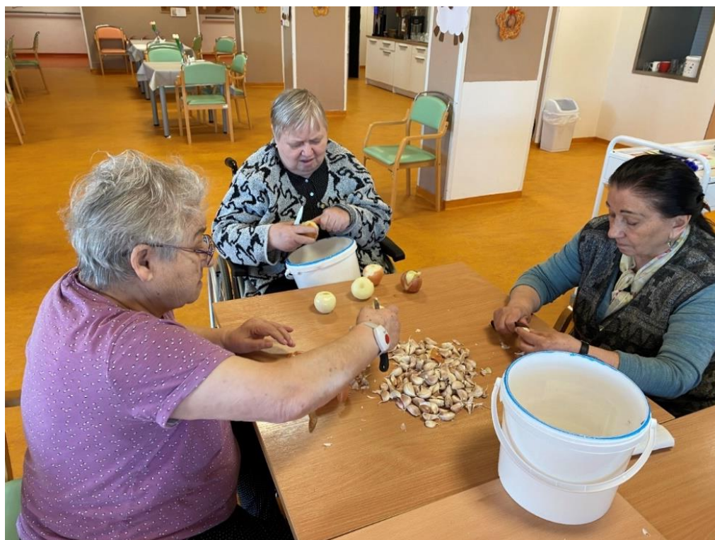
I při loupání cibule a česneku může být zábava