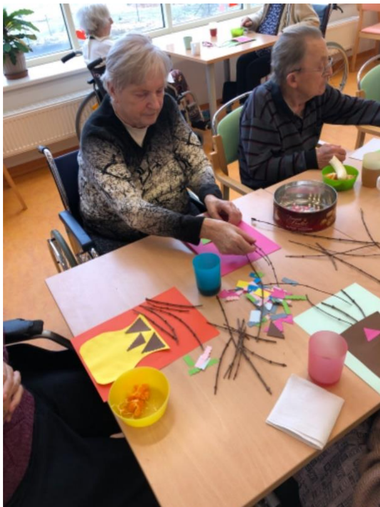
Naši klienti při výrobě jarní výzdoby