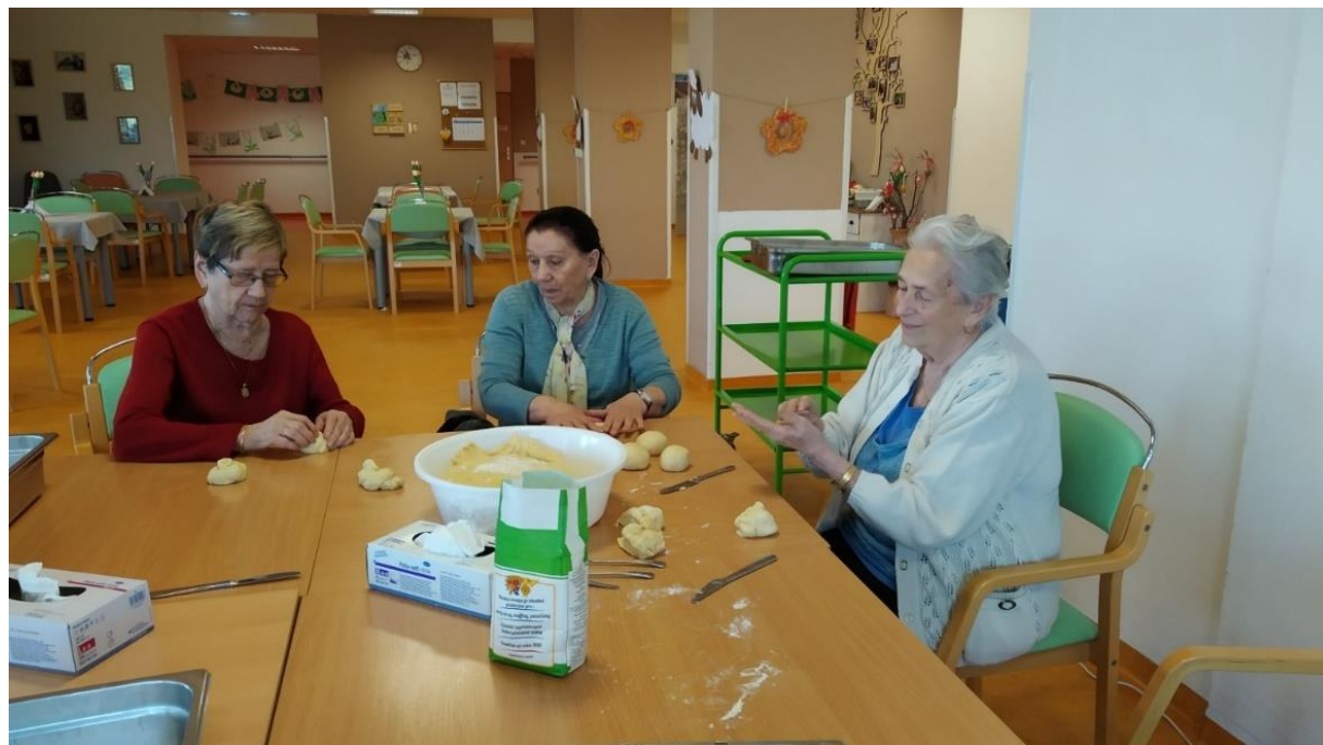
Bez práce nejsou koláče 🍪