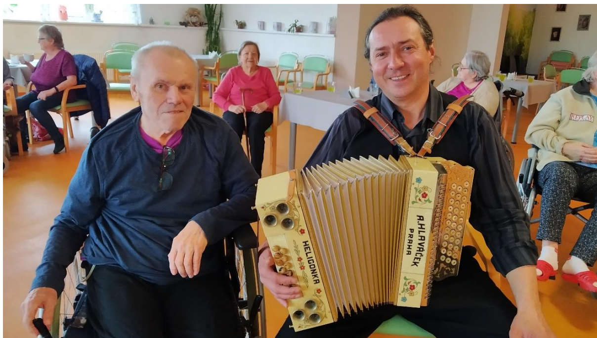
A muzika k zábavě také patří – takhle jsme oslavili svátek Josefa