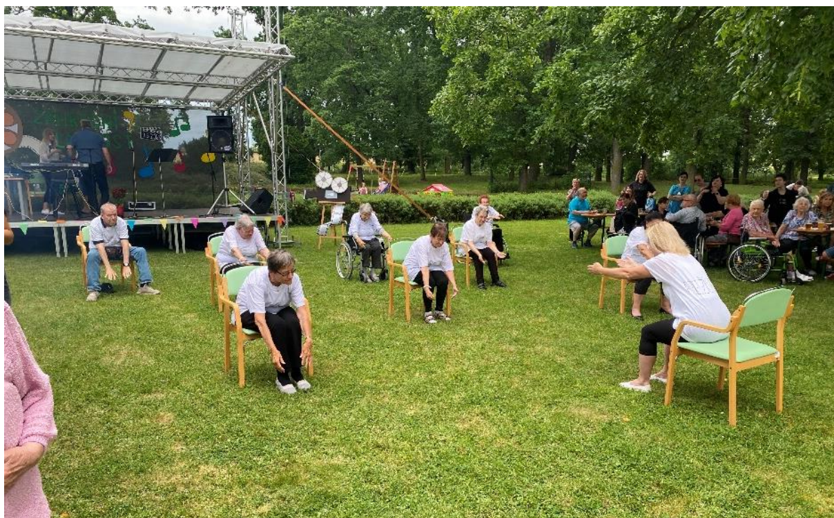
Na zahradní slavnost si naši klienti připravili vystoupení pro diváky – tanec v sedě